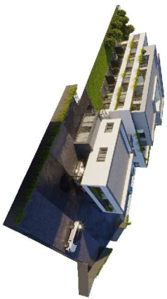
KOMORA - 2. NADZEMNÍ PODLAŽÍ